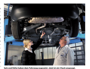
Salz und Kälte haben dem Fahrzeug zugesetzt. Jetzt ist ein Check angeht.

Werterhaltung nach dem Winter. Der Winter hat den Autos kräftig zugesetzt. Damit der rollende Unteratz durch Salz- und Schneereste keine Dauerchancen erleidet ist eine Reinigung und Pflege erforderlich.