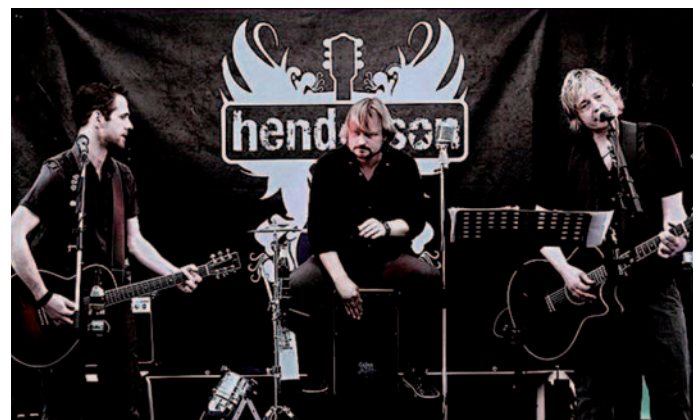
Die Gruppe „Henderson“ könnte man als Lokalmatador bezeichnen. Mit zwei akustischen Gitarren und einer Holzkiste als Schlagzeug covern sie bekannte Rock- und Popsongs.