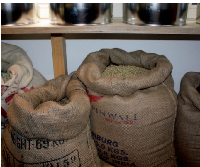
In Säcken wird der Rohkaffee geliefert.