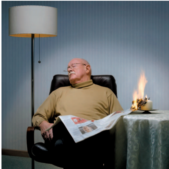
Ein älterer Mann schläft beim Zeitungslesen ein und löst einen Brand durch die Kerze aus.

Das Risiko, bei einem Wohnungsbrand ums Leben zu kommen, ist für Senioren doppelt so hoch wie für die restliche Bevölkerung. Laut „Statistischem Bundesamt“ sind 61 Prozent der Brandtoten in Deutschland über 60 Jahre alt. Die Aufklärungskampagne „Rauchmelder retten Leben“ hat deshalb jetzt eine Checkliste entwickelt, die älteren Menschen und ihren Angehörigen hilft, mögliche Gefahrenquellen im Haushalt zu erkennen und das Brandrisiko zu minimieren. Die Ursachen dafür sind vielfältig: Zum einen nehmen Mobilität und Sinneswahrnehmung mit zunehmenden Alter ab, zum anderen leben viele Senioren allein oder leiden unter Krankheiten wie Alzheimer oder Demenz. Die Checkliste und wertvolle Tipps zur Brandprävention für Senioren wurden auf der „Interschutz 2015“, der weltweit größten Fachmesse für Brand- und Katastrophenschutz, in Hannover präsentiert und stehen ab sofort unter www.senioren-brandschutz.de zur Verfügung. Die Auswertung erfolgt sofort nach dem Ausfüllen anhand eines einfachen Ampelsystems: Zeigt die Ampel beispielsweise auf rot, besteht ein erhöhtes Gefährdungsrisiko und es werden wichtige Handlungsanweisungen zur Verringerung des individuellen Brandrisikos gegeben.