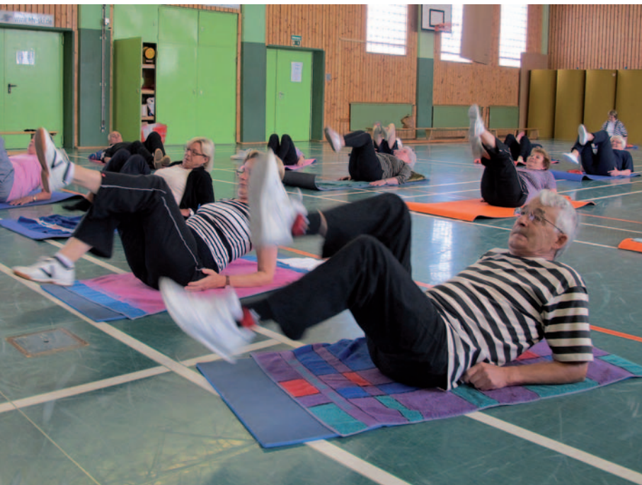
Auch am Boden fit: Sport ist schon längst keine Frage des Alters. Die goldene Generation stellt ihre Fitness im Sportverein oder in Sportkursen unter Beweis.

Aktion des Landessportbundes ist auch im Kreis Mettmann Programm / Zusammenarbeit mit den Sportvereinen und Senioreneinrichtungen der zehn Kreisstädte