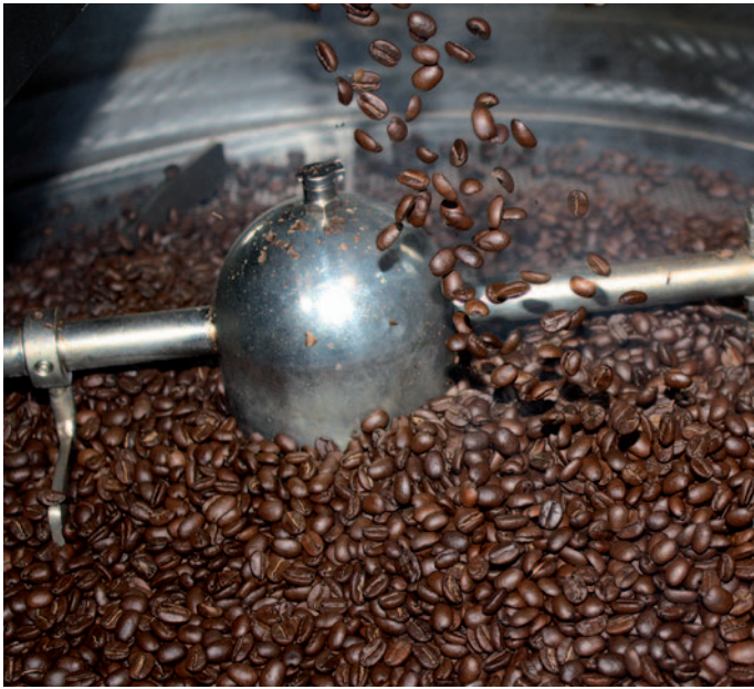
Die frisch gerösteten Kaffeebohnen fallen aus der Röstmaschine und füllen der Raum mit ihrem herrlichen Aroma.

Endlos: Einen Kaffee bezahlen, danach immer nachschenken, bis nichts mehr reingeht. Zu Weihnachten oder auf Bestellung gibt es auch den edlen Jamaica-Blue-Mountain-Kaffee. Kaffee-Verkostung: Auf Anfrage (nächster Termin am 31. Oktober 2015 um 17 Uhr)! Bei der Verkostung erfahren Sie Wissenswertes über Kaffeebohnen, ihren Anbau, die Ernte und die Veredlung. Gut vorbereitet, können Sie zwischen Fülle, Körper, Säure und Nebennoten unterscheiden. Vielleicht entdecken Sie dabei Ihren künftigen Lieblingskaffee. Aus drei Sorten des Hauses gibt es Kaffee-Pads, welche in allen gängigen Maschinen einsetzbar sind. Der übliche Röstvorgang