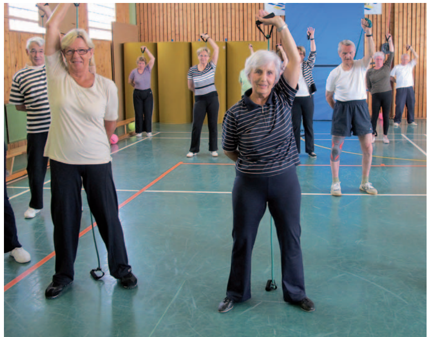
Fitness für den Rücken: Präventive Wirbelsäulen- oder Funktionsgymnastik ist eines der sportspezifischen Angebote im Gesundheitssport.

Bewegt ÄLTER werden im Kreis Mettmann – Fit und mobil dank Bewegung. Dem Senioren- und Gesundheitssport kommt aufgrund der demographischen Entwicklung eine immer größere Bedeutung zu. „Turne bis zur Urne.“ Ein Zitat, wenn es um Ratschläge zum Thema Bewegung im Alter geht. Zu Recht: Bewegung und Sport gelten als Schlüsselfaktoren für ein gesundes Altern. Mit dem Programm „Bewegt ÄLTER werden in NRW“ versucht der Landessportbund (LSB) möglichst viele Menschen im fortgeschrittenen Alter für Sport zu begeistern.