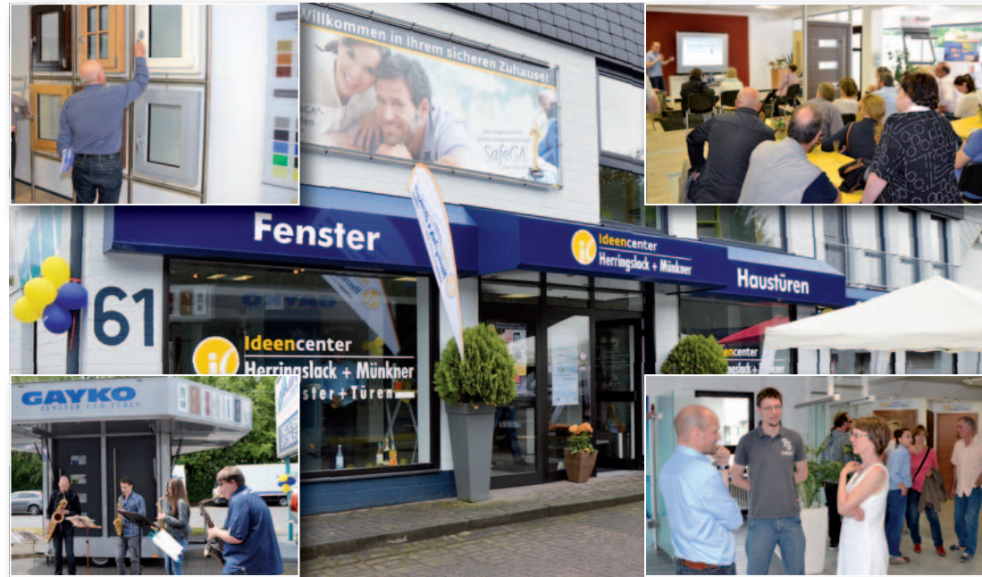
Eröffnung mit einem Tag der offenen Tür: Die neuen Ausstellungsräume des Ideencenters auf der Schneiderstraße in Langenfeld wurden mit einem kleinen Fest eingeweiht. Dazu gab es Fachvorträge zu den Themen Sicherheit und Energiesparen.

Das Ideencenter Herringslack + Münkner ist der Spezialist für Fenster und Türen