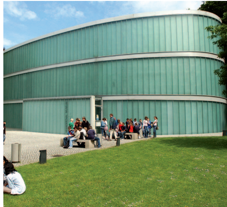
In diesem Frühjahr erwartet das Museum den dreimillionsten Besucher.

Mittlerweile sind die Kritiker verstummt und das Museum rangiert im internationalen Ranking