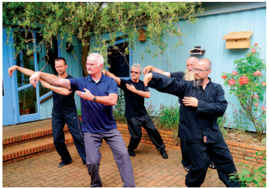
Beim Taiji Quan werden die Bewegungen langsam ausgeführt.

Mittwochs 10.30 bis 12 Uhr findet im Bürgertreff Lortzingstraße ein Qigong-Kurs (Die 15 Ausdrucksformen des Taiji Qigong) statt. Die Schlüsselpunkte, die den Übungen der „15 Ausdrucksformen“ zugrunde liegen, zielen dabei nicht ausschließlich auf körperliches Wohlbefinden. Ganz im Sinne der drei Harmonien: In Harmonie mit sich selbst, in Harmonie mit den Mitmenschen und in Harmonie mit der Natur, erstrecken sie ihre