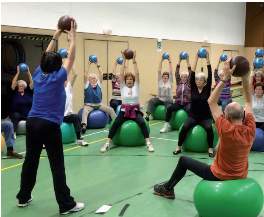
Gesundheitssport mit kleinen und großen Bällen: Eine beliebte Variante in den Rehabilitations-Sportangeboten.