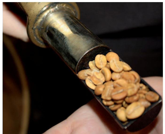
Immer wieder wird der Grad der Röstung überprüft.