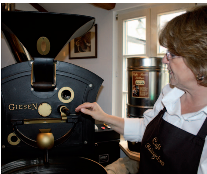
Mit Konzentration und Hingabe beim Rösten, denn das Timing ist entscheidend.

Jeden Samstag: „Café-Rösten live“ von 17 bis 18 Uhr – natürlich kostenlos, auch für Gruppen; nach vorheriger Anmeldung auch an anderen Terminen. Café-