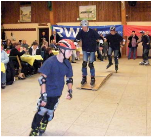
Rasante Vorführung: die Inline-Skatergruppe der BSG Langenfeld.