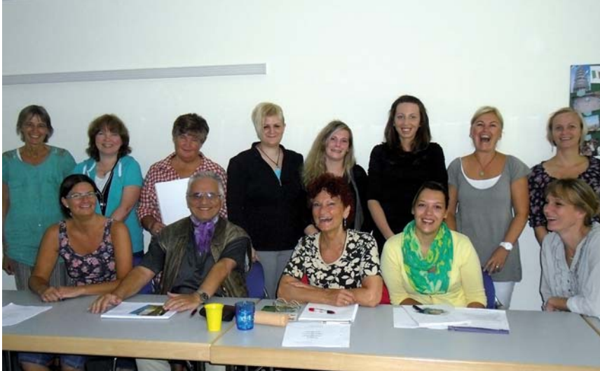
Die angehenden Tagespflegepersonen beim Start des Qualifizierungskurses.

An dieser Stelle werden lokale Ereignisse dokumentiert, die in der Stadt in den letzten Wochen für Gesprächsstoff sorgten und/oder in Zukunft noch sorgen werden