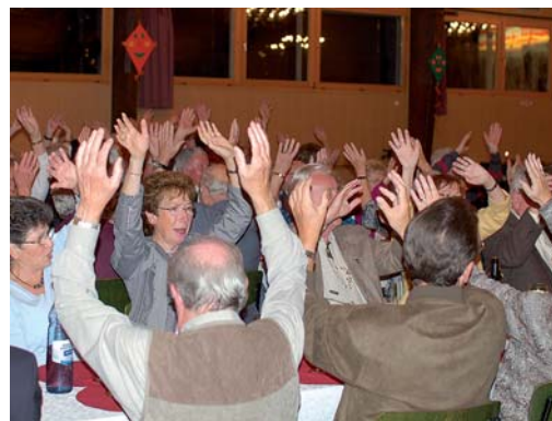
„Die Hände zum Himmel“ beim Erntedankfest.