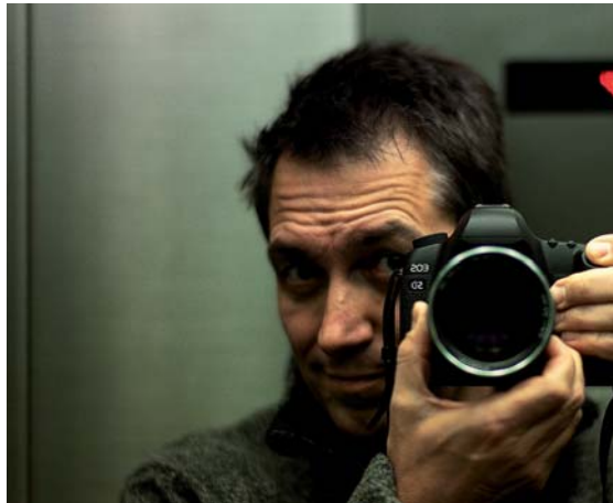
Im Kulturellen Forum zu sehen: Werke von Dieter Nuhr. Foto: Dieter Nuhr