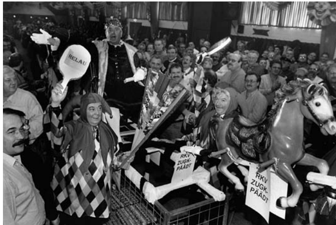
Damals wie heute – beim RKV lässt man es krachen.