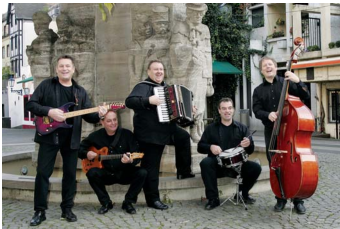
Die Rabaue sind bei der Prunk- und der Herrensitzung dabei.