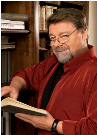
Jürgen von der Lippe.

Seien wir ehrlich: Jürgen von der Lippe ist der Mann mit den hässlichsten Hemden. Genauso mit Berechtigung spricht man aber vom großen Alleskönner der Unterhaltung: Der als Hans-Jürgen Hubert Dohrenkamp geborene Künstler gründete in den 70ern gemeinsam mit Hans Werner Olm die Gebrüder Blattschuss („Kreuzberger Nächte sind lang“), ab 1980 war er der Hausmeister im WWF Club und spätestens seit „So isses“ kennt die ganze Nation den Vollbartträger.