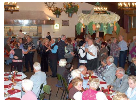
Am 6.10. wurde viel getanzt in der Hubertushalle.