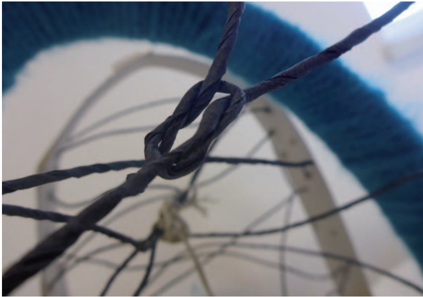
„Kreative Kunstwerke“ von Kopernikus-Realschülern zeigt die Stadtbibliothek.