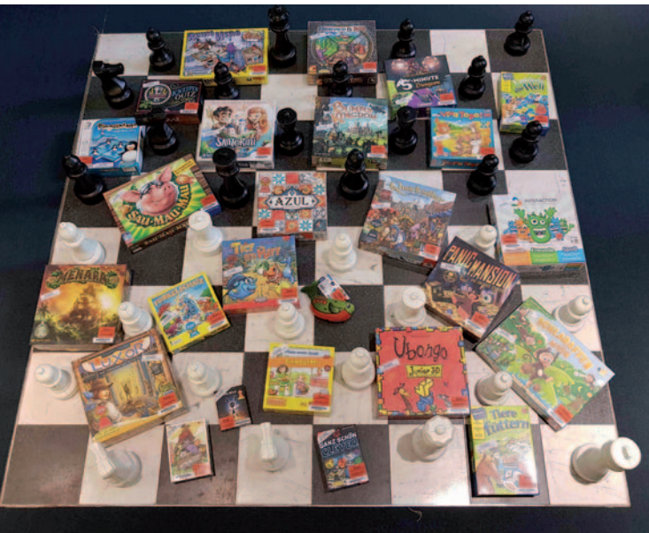
In der Stadtbibliothek kann man nun so manch neues Spiel ausleihen.