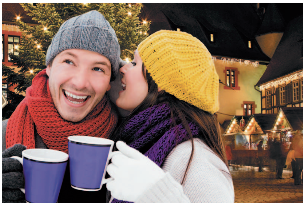
Weihnachten ohne Weihnachtsmärkte geht für die meisten Deutschen nicht. Am liebsten wird der örtliche Weihnachtsmarkt besucht.

Adventszeit ohne Weihnachtsmarkt? Das kommt für die überwiegende Mehrheit der Deutschen (80 Prozent) nicht in Frage, wie eine bundesweite Umfrage unter mehr als 1100 Nutzern des Städteportals meinestadt.de ergeben hat. Auch bei der Frage „Welcher Weihnachtsmarkt soll's