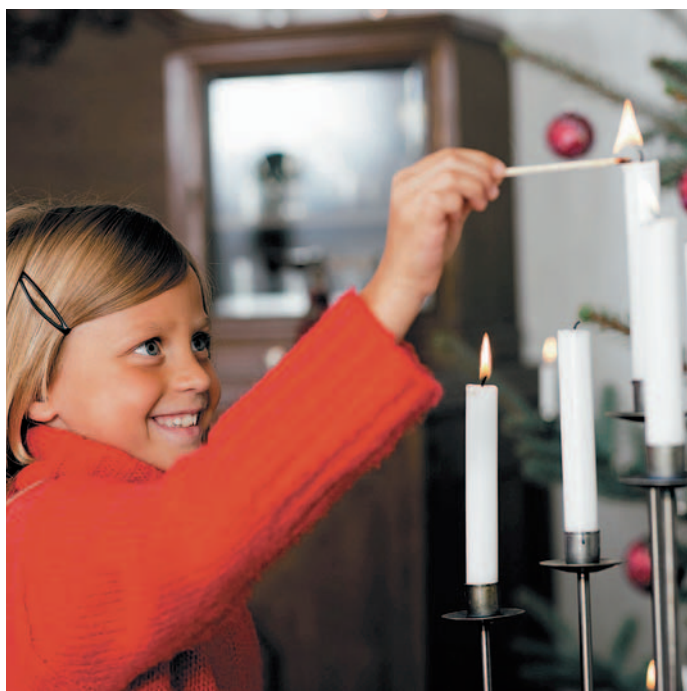
Echte Kerzen haben eine ganz besondere Atmosphäre. Dabei ist aber Vorsicht angebracht.

zu konsumieren?“ Reisch: „Wenn man den Markt betrachtet, dann sehen wir eine Zunahme bei fair gehandelten und vor allem bei regionalen Nahrungsmitteln, eine trotz Finanzkrise stabile Nachfrage an Bio-Lebensmitteln, eine steigende Nachfrage nach ethisch-ökologischen Geldanlagen, nachhaltiger Mode, sanftem Tourismus und Ähnlichem. Nachhaltiger Konsum ist ein Trend mit Wachstumschancen, aber überwiegend noch nicht massentauglich.“ (pb) ■