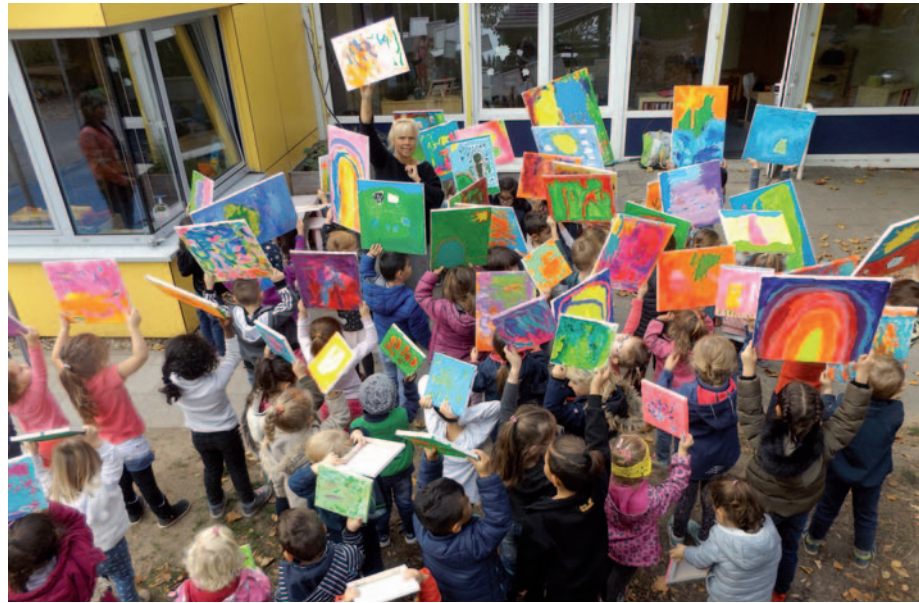
Kreativwoche in der Kita Immigrather Straße.