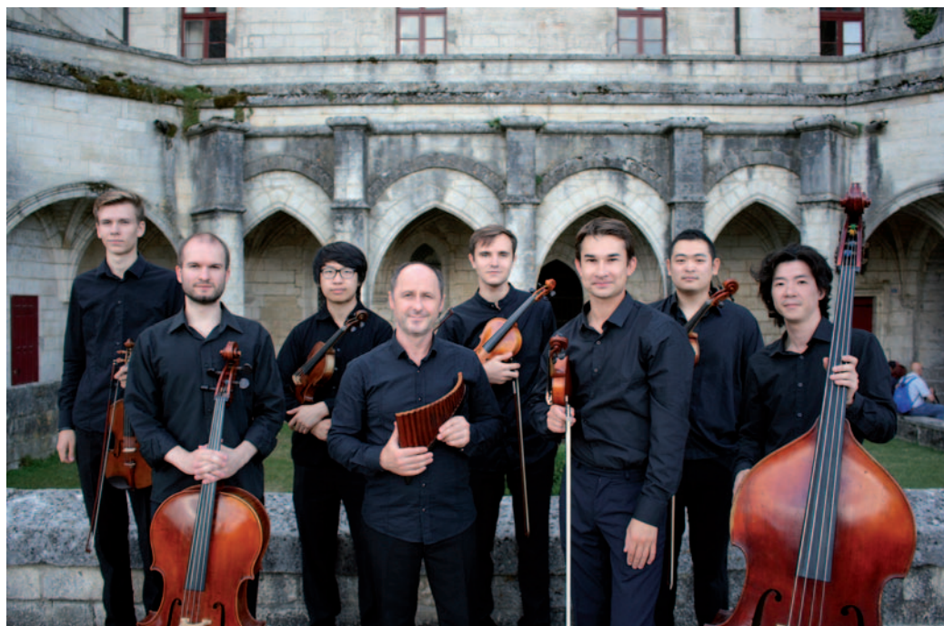
Diese Kölner Musikvirtuosen werden am 8. Dezember die Gäste in Wiescheid verzücken.