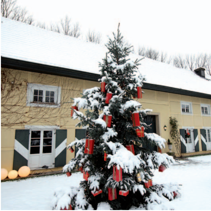
Die Wasserburg Haus Graven wird am 23. Dezember wieder zahlreiche Besucher anlocken.