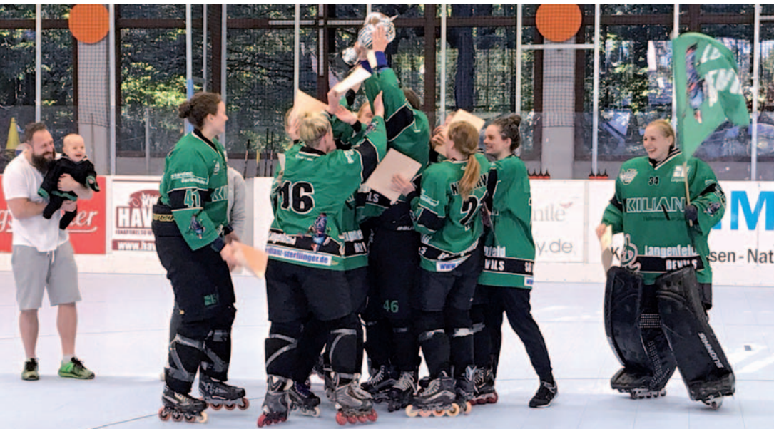
Bereits im Oktober sicherten sich die Damen der SGL Devils den deutschen Pokal.