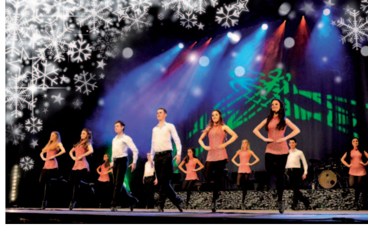
Danceperados of Ireland.