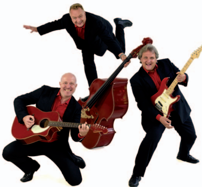
Die „Traveling Voices“ heizten den Besuchern des Weihnachtsmarktes in der Innenstadt am ersten Dezember-Wochenende ein.