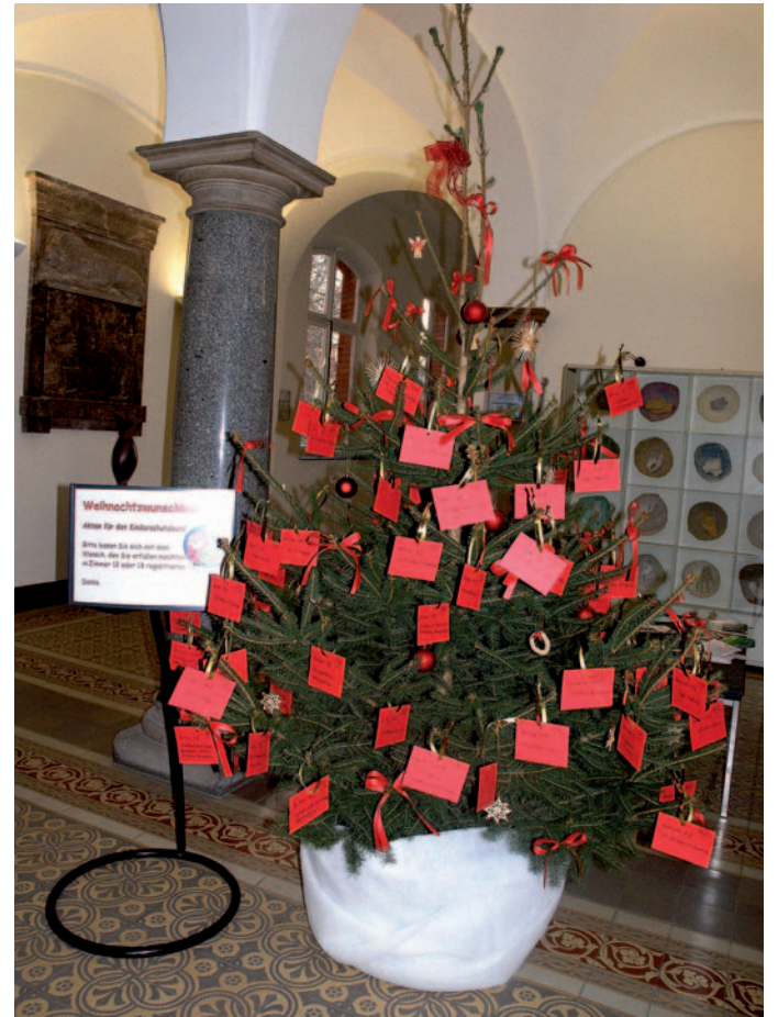
Der Weihnachtswunschbaum wird für glückliche Kinderaugen sorgen.

auspacken und die Magie des Festes erleben dürfen. Kinder aus ärmeren Verhältnissen und Flüchtlingskinder, deren Familien nur über sehr geringe finanzielle Mittel verfügen, müssten Weihnachten jedoch ohne Geschenke feiern. Damit das nicht passiert, organisieren die LVR-Klinik Langenfeld und der Kinderschutzbund Langenfeld auch in diesem Jahr wieder eine Weihnachtswunschbaum-Aktion. „Mit Ihrer Beteiligung haben Sie die Möglichkeit, zum guten Weihnachtself zu werden und dazu beizutragen, dass die Kinder am 24. Dezember ein Geschenk unter dem Weihnachtsbaum haben. Der Kinderschutzbund hat die Wünsche der Kinder erfragt und gesammelt. Diese können Sie ab dem 26. November bis zum 14. Dezember 2018 vom Weihnachtsbaum pflücken und erfüllen“, heißt es seitens der LVR-Klinik. Der Baum steht im Foyer des Verwaltungsgebäudes der LVR-Klinik Langenfeld an der Kölner Straße 82. Die Öffnungszeiten des Gebäudes sind Montag bis Donnerstag von 7.30 bis 16.30 Uhr und Freitag von 7.30 bis 13 Uhr. Die Wünsche, die auf Karten an dem Baum befestigt sind, wurden zum Schutz der Kinder und Familien anonymisiert dargestellt. „Um einen Wunsch zu erfüllen, pflücken Sie eine Karte vom