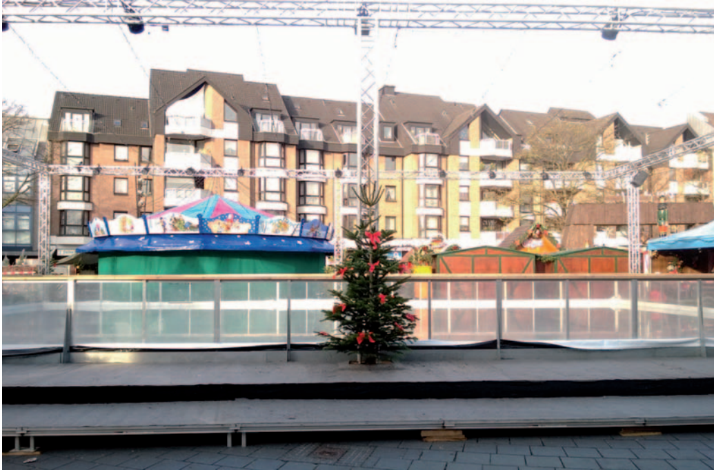
Die Eislaufbahn auf dem Marktplatz.