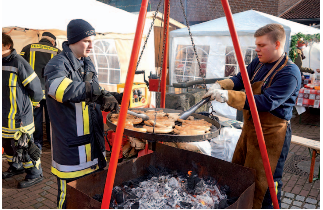
Mit den heiß begehrten Grillwürstchen ist die Feuerwehr vertreten beim Richrather Weihnachtsmarkt.